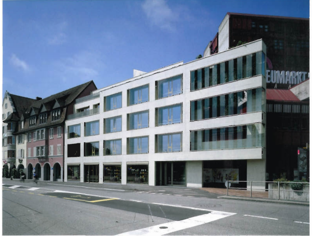
Bilder: Reinhard Zimmermann

In den 60er Jahren liess ein uneingeschränkter Wachstumsglaube kühne Stadterneuerungspläne für das Brugger Bahnhofquartier entstehen. Diese landeten nicht wie viele ihrer Zeit in der Schub-lade, sondern fanden dank starken Investoren und willigen Behörden ihren Niederschlag in einem rechtsgültigen Richtplan. Im so genannten goldenen Dreieck zwischen Altstadt und Bahnhof sollte auf der Basis einer Tabula rasa ein System von gedrungenen Hochhäusern mit zweigeschossigen Sockelbauten realisiert werden. So bemerkenswert